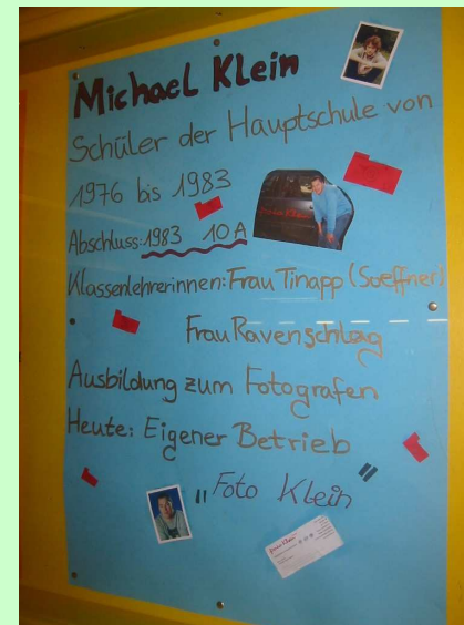
Michael Klein Abschluss 1983 jetzt Fotograf mit eigenem Fotostudio